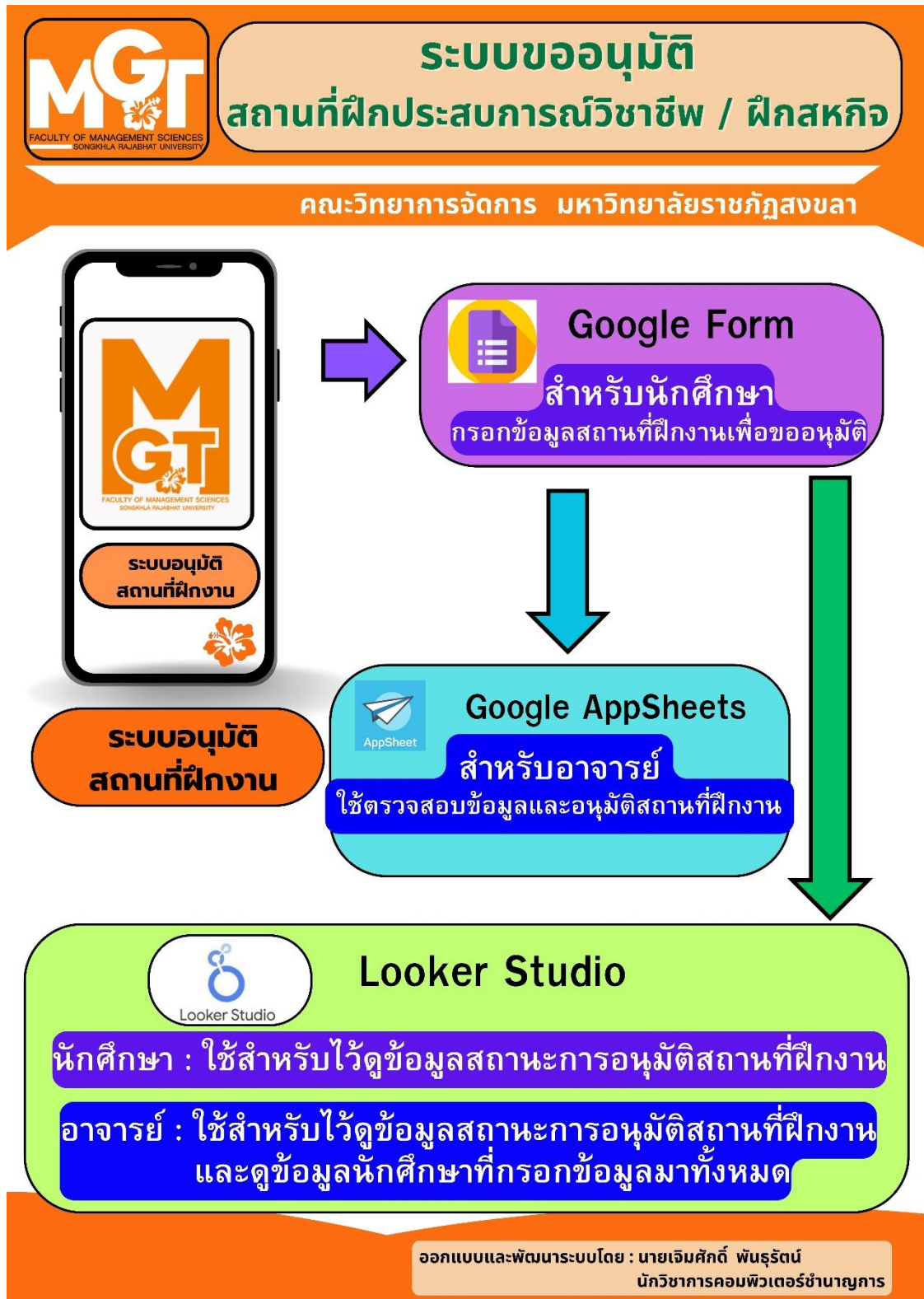
ภาพที่ 2 ขั้นตอนการทำงานของระบบการขออนุมัติสถานที่ฝึกประสบการณ์วิชาชีพ / ฝึกสหกิจศึกษา ของคณะวิทยาการจัดการ รูปแบบ Flow Chart