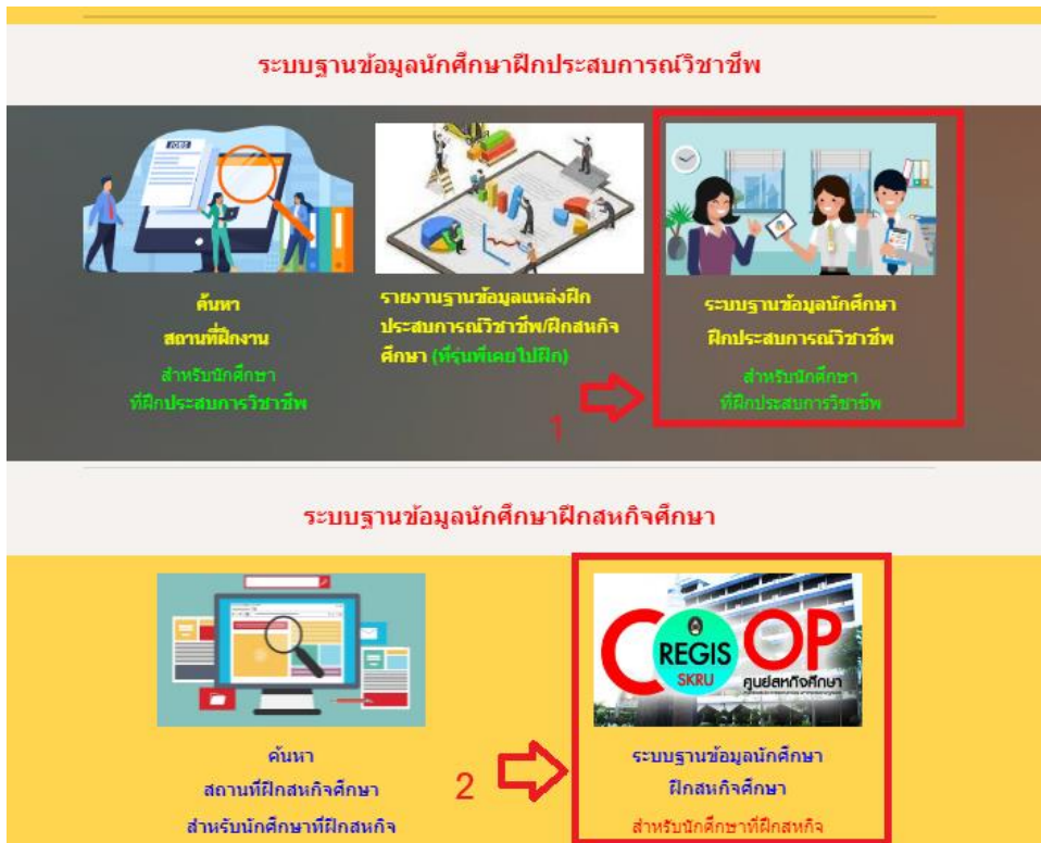
ภาพที่ 11 หน้าระบบฐานข้อมูลนักศึกษาฝึกประสบการณ์วิชาชีพและเข้าระบบฐานข้อมูลนักศึกษาฝึกสหกิจศึกษา